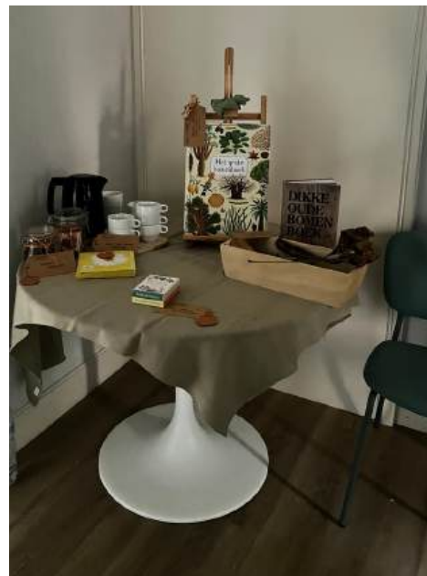
Koken met de kids next door